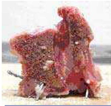
FIGURA 2. Vértebra torácica de cerdo montada en su plataforma para facilitar las pruebas mecánicas.