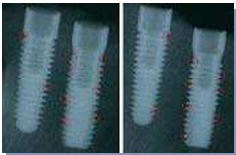
FIGURAS 4A y B. Radiografías de los especímenes óseos con un implante de cada diseño instalado. Se observó un mayor BIC para los cónicos que para los cilíndricos. Los círculos rojos ilustran las zonas con falta de contacto entre hueso e implante.