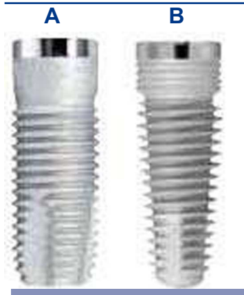
FIGURAS 1A y B. A. Renova Straight. B. Renova Tapered.

menes óseos fueron instalados en una plataforma de madera y fijadas a ésta mediante alambres en la base de la vértebra, lo más alejado posible del sitio de instalación de los implantes, previo a la instalación de estos, para facilitar así la ejecución de las pruebas mecánicas que fueron realizadas posteriormente. Luego los implantes fueron colocados mediante una técnica quirúrgica lo más atraumática posible, ciñéndose a las indicaciones y protocolo del fabricante sin la utilización de la fresa formadora de rosca o "tap", utilizando un motor quirúrgico modelo VCT Aseptico AEU-925, con un contraángulo reductor 20:1 modelo AHP-85P y realizando una copiosa irrigación externa mediante jeringas con suero fisiológico a temperatura ambiente.