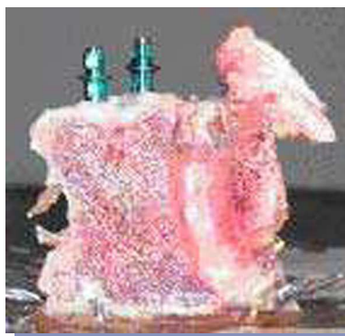
FIGURA 3. Vértebra de cerdo con un implante de cada diseño instalado.